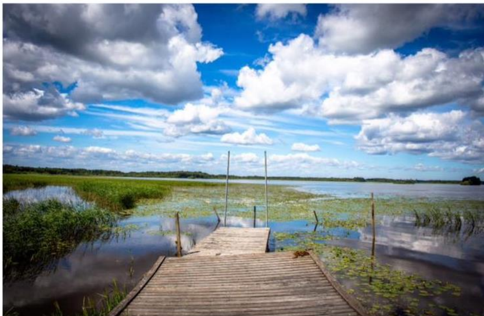
Tämnaaren ligger i tre kommuner: Heby, Tierp och Uppsala.

Fotografiet över Tämnaaren är från Järpebo.